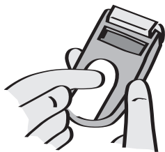
ກວດນ້ຳຕານໃນເລືອດ