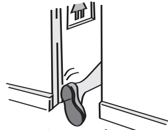
ຖ່າຍເບົາເລື້ອຍໆ