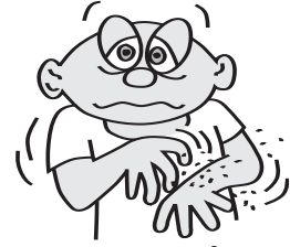
ຜິວໜັງແຫ້ງ