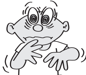
ສາຍຕາວມົວ