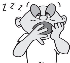
ຄວາມງ່ວງນອນ