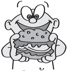
ຫິວເຂົ້າ

ສາຍເຫດ: ອາຫານຫລາຍໂພດ, ອິນຊິວລິນຫນ້ອຍໂພດ, ການເຈັບໄຂ້ ຫລື ການຕິງຄຽດ ການເລີ່ມຕົ້ນ: ເປັນເທື່ອລະໜ້ອຍ, ອາການຈະໜັກໜ້າກ້າວ ໄປເຖິງການໝົດສະຕິຍ້ອນພະຍາດເບົາຫວານ (Diabetic coma) ໄດ້. ນ້ຳຕານໃນເລືອດ: ສູງກວ່າ 240 mg/dL