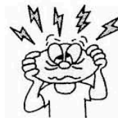
Pananakit ng ulo