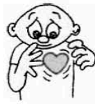
Mabilis na tibok ng puso