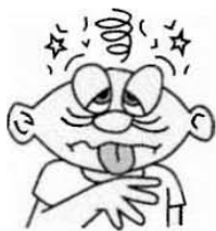
Pakiramdam na Ibig Masuka