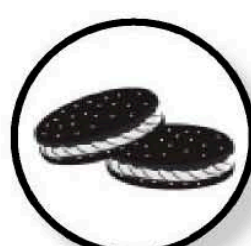
Hai cái bánh, Như là Oreos