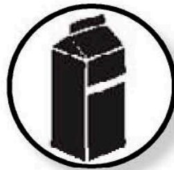
Tám ounces sữa