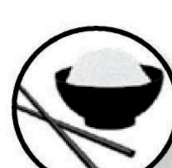
Một phần ba chén gạo / mì